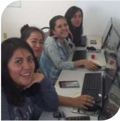
Alumnas: Centro CODAF Magdalena Contreras, CDMX.