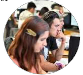
Alumnos: Centro CODAF Magdalena Contreras, CDMX.