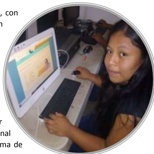
Alumna: Centro CODAF San Pedro Amuzgos, Oaxaca.

ellos, los jóvenes realizan sus estudios de bachillerato en línea junto con talleres presenciales del programa Educación en el Ser Fortaleciendo el Saber.