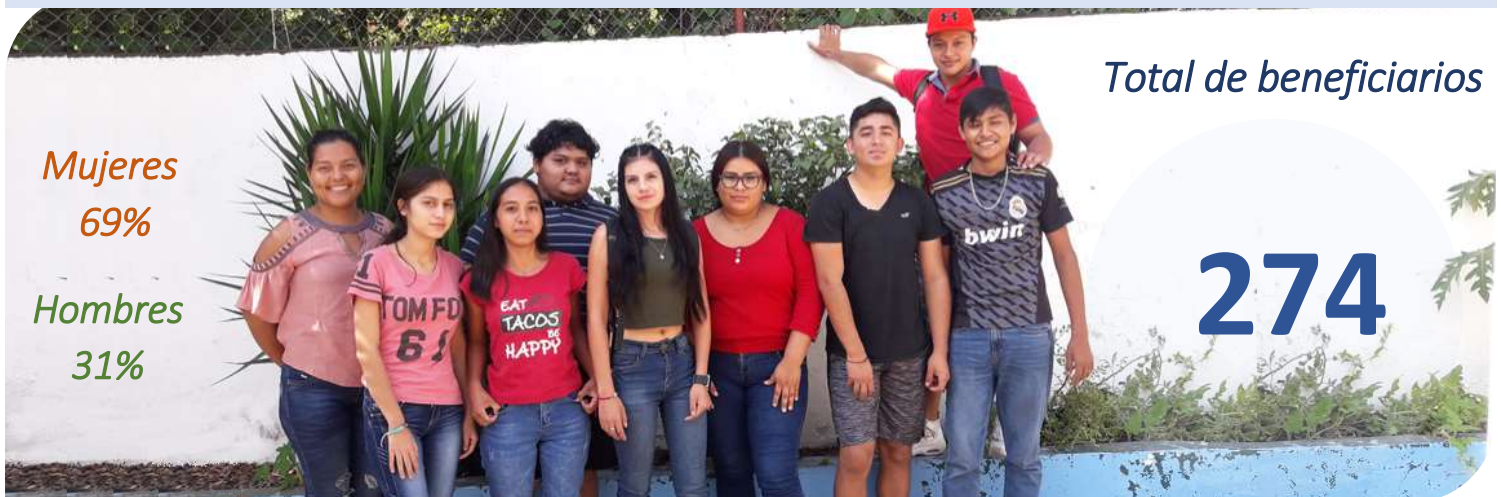
Alumnos: Centro CODAF Lázaro Cárdenas, Michoacán.